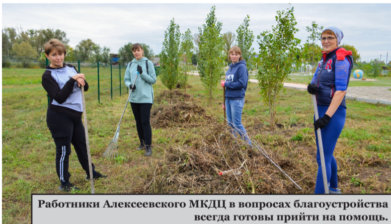
Работники Алексеевского МКДЦ в вопросах благоустройства всегда готовы прийти на помощь.