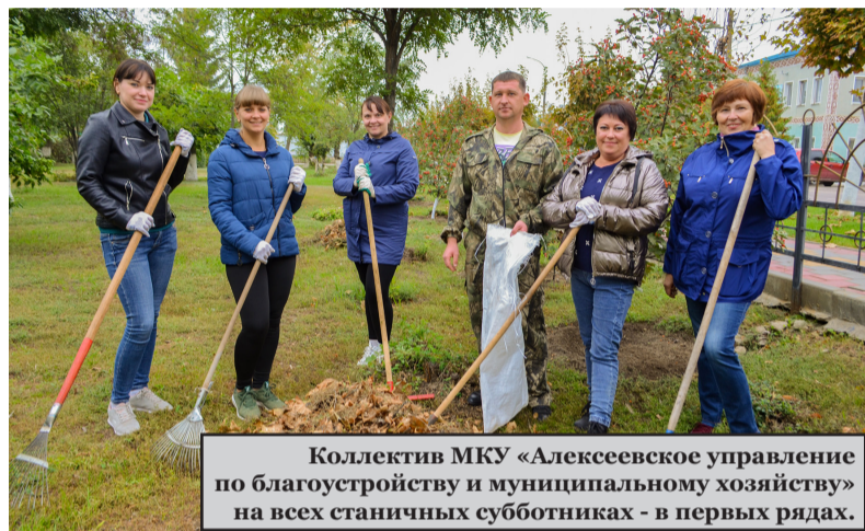
Коллектив МКУ «Алексеевское управление по благоустройству и муниципальному хозяйству» на всех станичных субботниках - в первых рядах.