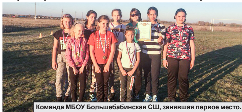
Команда МБОУ Большебабинская СШ, занявшая первое место.

17 октября состоялись соревнования среди учащихся школ Алексеевского района