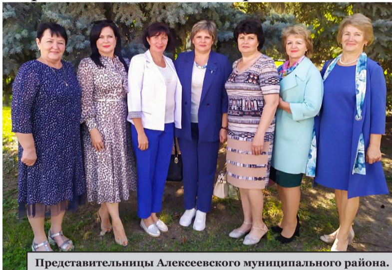
Представительницы Алексеевского муниципального района.

Представительницы Алексеевского района приняли участие в работе актива «Волгоградского областного Союза женщин»