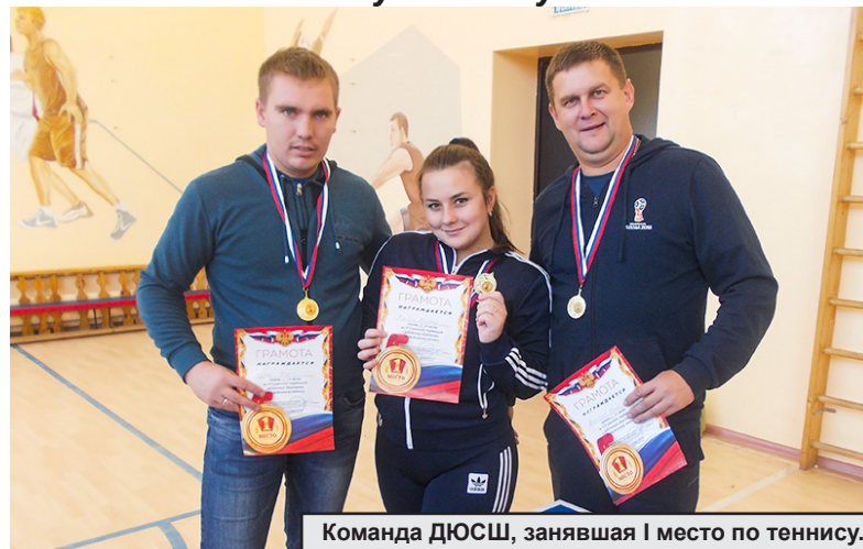
Команда ДЮСШ, занявшая I место по теннису.

2 ноября в районном центре состоялись два вида XIX районной спартакиады работников районного образования по настольному теннису и шахматам