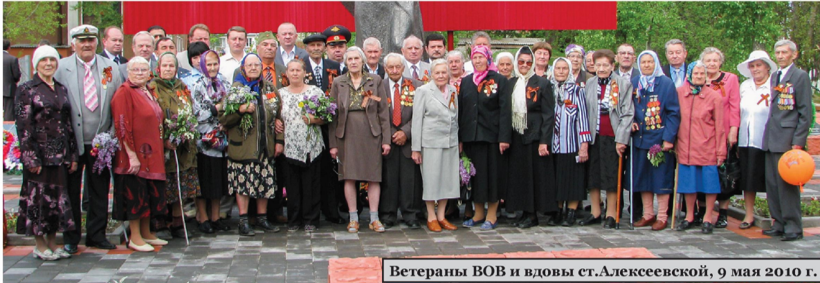
Ветераны ВОВ и вдовы ст.Алексеевской, 9 мая 2010 г.

Есть события, над которыми время не властно, и чем дальше в прошлое уходят годы, тем яснее становится их величие