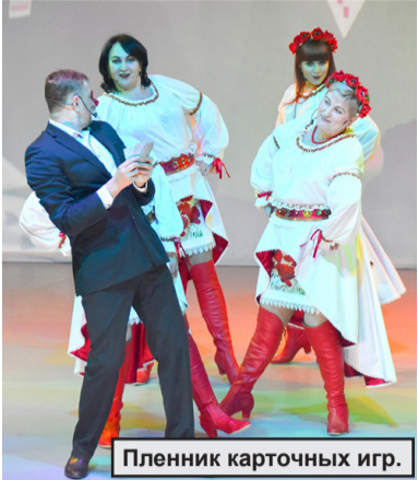
Пленник карточных игр.

13 и 20 января состоялось самое долгожданное шоу наступившего года - новогодний мюзикл «Сердца.net»