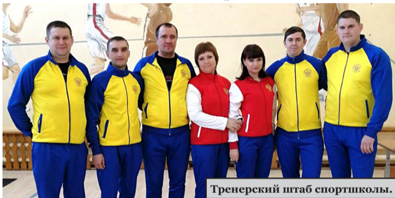
Тренерский штаб спортшколы.

Жители Алексеевского района активно сдают нормативы ГТО